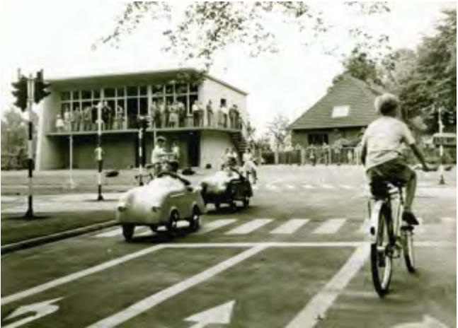
Zukünftige Könner auf dem Rad und im Auto: Verkehrsübungsplatz in den 50er-Jahren.