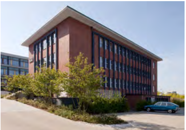
Das Laborgebäude an der Konrad-Adenauer-Allee ist nach der Sanierung ein baukulturelles Zeugnis der Geschichte des Hochofenwerkes.