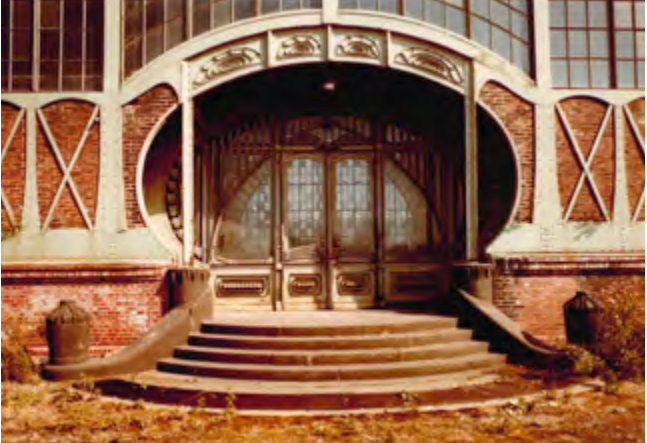
Zählte bis Ende der 1960er-Jahre zu den wenig geschätzten Industrieanlagen: die Zeche Zollern II/IV, hier das Portal der Maschinenhalle 1970.

Dreißig bis vierzig Jahre später wurden viele dieser Gebäude der Nachkriegs- und Wiederaufbauzeit nicht mehr geschätzt. Für die Denkmalbehörde bedeutete dies zunächst, mit großem Aufwand den Bestand dieser Zeit zunächst zu erfassen, später zu bewerten und letztlich in die Denkmalliste einzutragen. Wie schon bei den Industriezeugnissen musste viel Aufklärungsarbeit betrieben werden. Von den „50ern“ wollte in den 1990er-Jahren kaum einer etwas wissen. Das bezog sich sowohl auf die Architektursprache als auch die bauphysikalischen Probleme, die mit der Leichtigkeit und Transparenz einhergingen. Inzwischen hat sich das Verhältnis geändert, was sich im Alltag an manchem Retrotrend in der Mode und dem Interieur ablesen lässt.