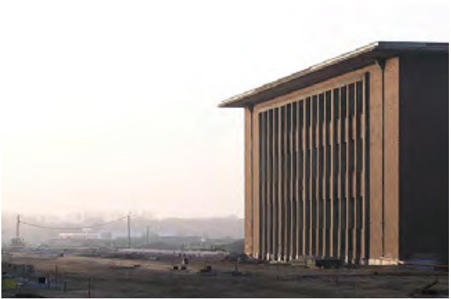
Historische Aufnahme vom Labor Phoenix auf dem Gelände des Hochofenwerkes.