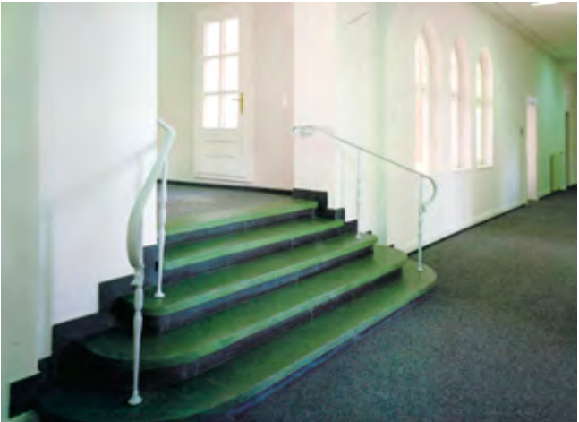
Das Wohlfahrtsgebäude in Eving, in dem sich früher u. a. Kindergarten, Hauswirtschafts- und Kochschule, Wäscherei, Bibliothek und eine Badeanstalt befanden, nach der Restaurierung 1992.