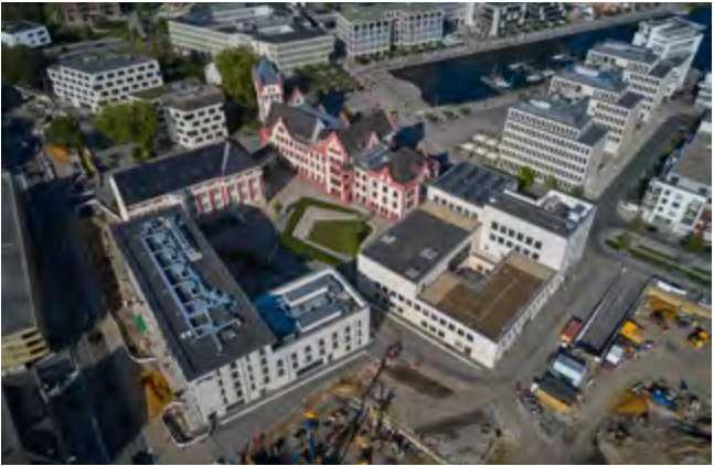
Einbindung der historischen Hölder Burg in den neuen städtebaulichen Kontext am Phoenix See.