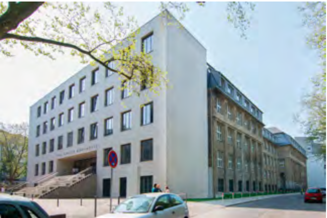
Das von Friedrich Kullrich 1908 gebaute und vor einigen Jahren sanierte und erweiterte Fritz-Henßler-Berufskolleg.

Ein weiteres Denkmal, das sich über die Jahre immer wieder wandelte, ist das Fritz-Henßler-Berufskolleg im Brüggmannblock, erbaut von Friedrich Kullrich im Jahr 1908. Seine denkmalgerechte Sanierung und gestalterisch hochwertige wie effektive Erweiterung von 2013 bis 2015 durch das Büro SSP Architekten zeigen, wie gut es gelingen kann, baugeschichtlich wertvolle Gebäude für die Nachwelt zu erhalten und in ihrem originären Sinne weiterhin zu nutzen – eine Kontinuität des Weiterbauens, auch im Sinne der Nachhaltigkeit. Heute besteht zumindest weitestgehend Einigkeit darüber, dass der weitere Umgang mit dem vorhandenen und umfangreichen Baubestand vor allem unter diesem Aspekt und der Ressourcenschonung sinnvoll ist. Schön wäre es, wenn eine Weiternutzung auch bei nicht geschützten Bauten zur Selbstverständlichkeit und das gesamte baukulturelle Erbe als Ressource anerkannt wird. Für die dann erforderlichen Instandsetzungs- und Sanierungsmaßnahmen an Bestandsbauten können derart gelungene Denkmalprojekte eine wichtige Vorbildwirkung entfalten.