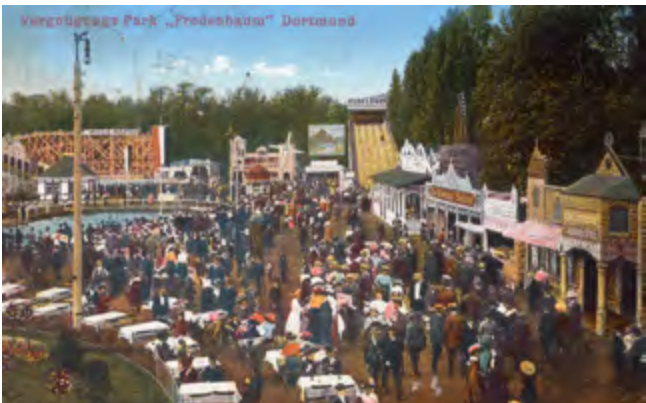
Bunte Vergnügungen: Lunapark 1912.

Die Lunaparks waren eher eine Art feste Kirmes als ein Park. Auch der Dortmunder Magistrat wünschte sich so eine Belustigung für die Arbeiterschaft. Wo, wenn nicht im Fredenbaumpark hätte er stehen können? So wurde der „Luna-Vergnügungspark“ am Ostersonntag 1912 eröffnet. Er besaß eine 12 m hohe Wasser-Rutschbahn, eine Gebirgsbahn und eine kleine Sommerrodelbahn, Schießbuden, Autokarussell, Hippodrom und andere Vergnügungen und in der „humoristischen Küche“ konnte man für 25 Pfennig Geschirr zerschlagen. Der kleinere Fredenbaumsaal wurde zum Oberbayerischen Festsaal umfunktioniert. Zudem gab es viele andere gastronomische Möglichkeiten. Das Geschäft boomte bis Sommer 1914, dann folgte ein Einbruch durch den Krieg. 1926 wurden noch Gebirgsbahn und Aquarium aufgebaut, insgesamt war die Zeit des Luna-Parks jedoch vorbei.