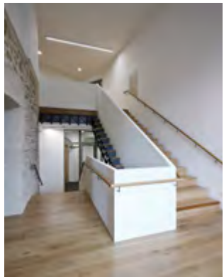
Das Wechselspiel von Altem und Neuem galt es beim Umbau der Hölder Burg zu berücksichtigen. Die historische Treppe musste brandschutztechnisch ertüchtigt werden.