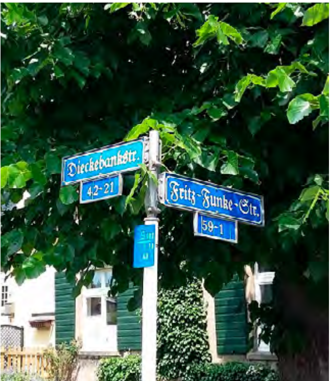
Straßenschilder in alter Schrift zeigen den Umriss der Siedlung auf.

„Belohnt“ wurden die Hauseigentümer*innen mit der Teilnahmemöglichkeit an einem Hof- und Fassadenprogramm, über das bestimmte Verschönerungs- und Renovierungsmaßnahmen an den Zuwegungen und Hausfassaden bis zu 50 Prozent von der Stadt Dortmund übernommen wurden. Die Zusammenarbeit mit der Denkmalbehörde funktionierte nun nahezu reibungslos, da der Siedlung eine zuverlässige Sachbearbeiterin zugeordnet wurde, die in der Folgezeit als Ansprechpartnerin für alle Anfragen zur Verfügung stand und Präsenz zeigte. Eine wichtige und notwendige Voraussetzung für eine erfolgreiche Zusammenarbeit zwischen Amt und Bürger*innen! Diese sollte dauerhaft gewährleistet sein, um die denkmalgeschützte Substanz der Häuser zu erhalten und das Nichtbeachten des Denkmalschutzes zu unterbinden. Austausch und Gespräch waren und sind einer der Hauptansprüche der Zusammenarbeit zwischen der IG Zechensiedlung und der Denkmalbehörde.