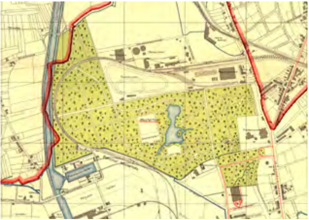
Nach der Umgestaltung: Der Fredenbaumpark 1914.