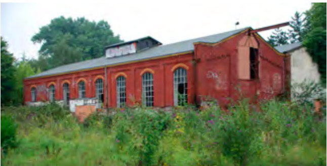
Die beiden Hallen, in denen bis 1963 die Verwaltung und die Kauen der Zeche Dorstfeld I/III untergebracht waren, standen viele Jahre lang leer.

Das Ende dieser beispiellosen Entwicklung setzte in den Fünfzigerjahren ein, mitten in den Wirtschaftswunderjahren der Bundesrepublik. Die heimische Kohle bekam Konkurrenz durch die wachsende Verfügbarkeit von billigerer Kohle insbesondere aus den USA. Ein schleichender Prozess des Zechensterbens begann und damit ein Anwachsen der Arbeitslosigkeit. Mit der Zeche Minister Stein in Dortmund-Eving wurde 1987 schließlich die letzte Zeche stillgelegt, und eine große Ära der Steinkohleförderung in der Stadt fand sein Ende. Damit stellte sich die Frage an die Politik, die Wirtschaft, die Städteplanung und eben auch an die Denkmalpflege, wie mit den großen Industriebrachen und den darauf befindlichen Übertageanlagen der Zechen umzugehen sei. Sollten die baulichen Zeugnisse einer großen Industrieepoche einfach verschwinden? Eigentlich undenkbar. Doch wie sollte das Undenkbare möglich gemacht und die alten Anlagen mit einer neuen Nutzung in eine Zukunft gebracht werden?