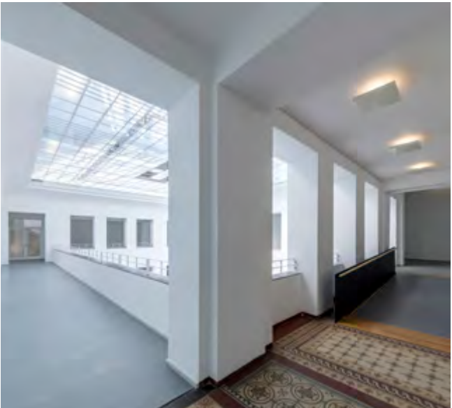
Das Baukunstarchiv NRW im Innern.