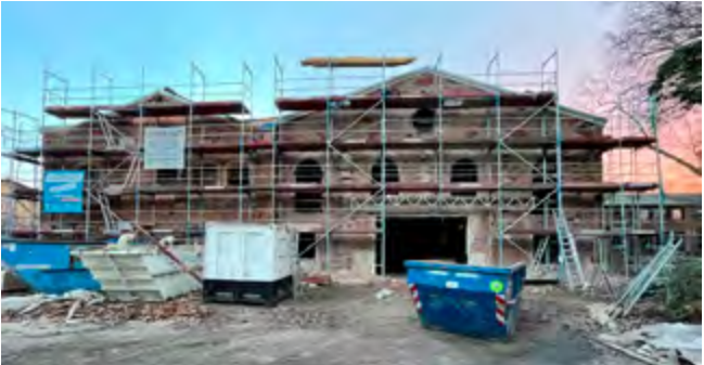
Die seit 1987 unter Denkmalschutz stehenden Gebäude wurden zwischen 2018 und 2022 zu einem Bürgerhaus umgebaut.

Ideen waren gefragt. Eine wichtige Rolle in dieser strukturellen Krise war die Internationale Bauausstellung Emscher Park, die von 1989 bis 1999 lief. Die 1992 abgeschlossene denkmalgerechte Sanierung des ehemaligen Wohlfahrtsgebäudes von 1903 in der Alten Kolonie Eving war das erste fertiggestellte Projekt der IBA Emscher Park. Bei dem Festakt zur Einweihung hielt der Geschäftsführer, Professor Karl Ganser, eine flammende Rede für die Notwendigkeit, wichtige Zeugnisse der Industriegeschichte zu erhalten, und die Chancen, die sich daraus für den Menschen ergeben.