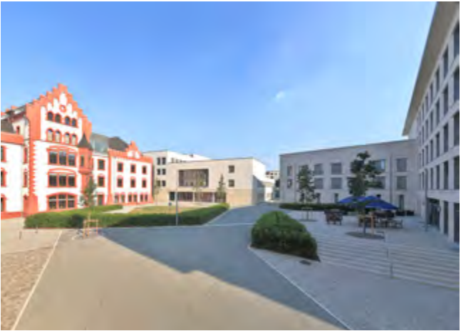
Blick in den Hof der umgebauten Hördter Burg mit Neubau und Hotel, 2016.