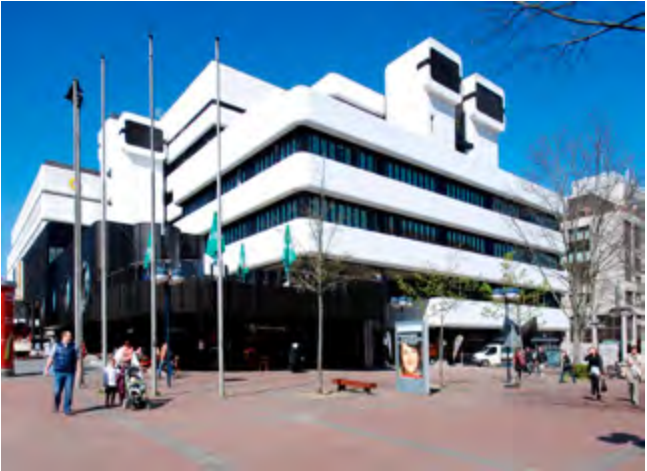
Das ehemalige, von Hans Deilmann in den 1970er-Jahren entworfene Bankgebäude.

So auch geschehen beim nächsten Denkmal, dem heutigen DOC Medical Center in der Kampstraße. Das denkmalgeschützte Gebäude der früheren WestLB von Harald Deilmann aus dem Jahr 1978 wurde zwischen 2011 und 2014 durch Eller + Eller Architekten zum Ärztezentrum umgebaut. Als jüngstes Baudenkmal 2011 in die Denkmalliste der Stadt eingetragen, ist es noch immer ein Sonderfall. Und das, obwohl Dortmund mit seinem Stadtzentrum, das nach dem Zweiten Weltkrieg fast vollständig neu errichtet wurde, für die Beschäftigung mit der Nachkriegsmoderne eine breite Bühne bietet. Hier sind Zeugnisse von Architektur und Städtebau dieser Epoche in besonderer Dichte und verschiedenen Qualitäten überliefert. Die Denkmalpflege untersucht immer öfter das Erbe dieser Zeit auf seinen Denkmalwert hin und wird auch immer häufiger aus der Öffentlichkeit heraus dazu aufgefordert. Dem Engagement von Denkmalschützer*innen, Architekt*innen – und im Falle der WestLB besonders dem Bund Deutscher Architekten BDA –, Stadtplaner*innen und Stadtbewohner*innen ist es zu verdanken, dass der Bau überhaupt erhalten und denkmalgerecht saniert werden konnte. Das Gebäude ist Beispiel und Beleg dafür, dass und wie man ein Baudenkmal der Nachkriegsmoderne erhalten, pflegen und weinternutzen kann.