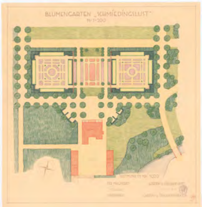
Ein Blumengarten für den Fredenbaumpark: Entwurf von Richard Nose 1929.

1925 bekamen die Fredenbaumsäle mit der Westfalahalle eine ernste Konkurrentin. Der Fredenbaumpark begnügte sich nun mit Events wie der Rassegeflügelausstellung 1927 und der Ausstellung „Im Reich der Hausfrau“ des Hausfrauenbundes 1932. Man konnte schon an diesen Veranstaltungen die neue Mentalität des NS-Regimes erahnen, welcher der bunte Lunapark ein Dorn im Auge war. Am 20. Januar 1940 wurde der Antrag auf Abbruch fast aller Anlagen gestellt, angeblich wegen Baufälligkeit. Man schloss den Park und gab ihn dem Verfall preis. Die Reste des Fredenbaumsaales und des Aquariums standen noch bis 1958, dann war der Lunapark Geschichte.