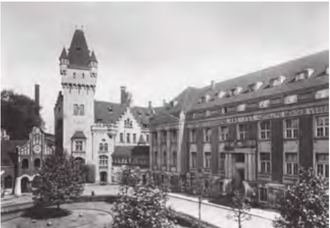
Die Hördter Burg um 1930 in ihrem ursprünglichen historischen Kontext.