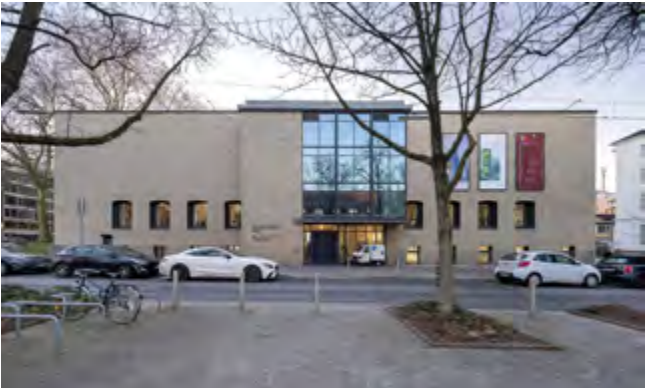
Das Baukunstarchiv NRW im Haus am Ostwall 7.