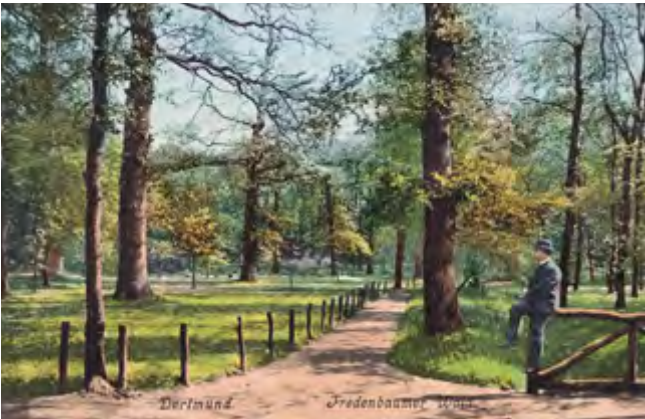
Ein Sonntagsspaziergang: Fredenbaumpark um 1900.

Als Dortmund im Oktober 1802 seine Eigenständigkeit an Wilhelm von Oranien-Nassau verlor, erklärte man den Grundbesitz der Stadt und Grafschaft Dortmund zum Staatseigentum. 1808 wurde Dortmund dann dem neugebildeten französischen Großherzogtum Berg „einverleibt“, das bereits 1813 wieder aufgelöst wurde. Als 1819 die neue preußische Regierung den Städten das Recht auf Landbesitz zurückgab, ging die staatliche Waldfläche wieder in das Eigentum der Stadt Dortmund über. Durch weitere Zukäufe stockte man den Stadtwald zur heutigen Größe auf.