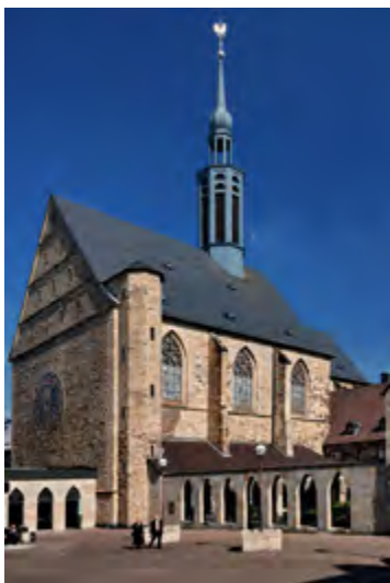
Blick auf die Probsteikirche mit modernen „Zutaten“ in Sandstein.