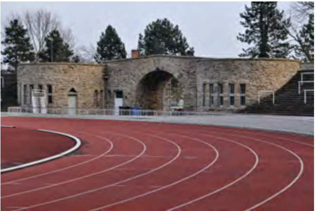
Blick auf das Marathontor, Stadion Rote Erde. Erbaut 1925-27 unter maßgeblicher Mitwirkung des Stadtbaurates Hans Strobel.

In den vergangenen Jahrhunderten gab es zahlreiche größere und kleinere Ruhrsandsteinbrüche in der Region. Dabei traten die Betreiber der großen Steinbrüche meist zugleich als Bauunternehmer auf. Ihr Fokus lag zuerst auf den oberflächennahen Gesteinsvorkommen, die nördlich der Ruhr im Ardeygebirge und westlich auf beiden Ruhrseiten bis nach Mülheim verortet sind. Das gebrochene Baumaterial wurde für den Bau von Sakral- und Profanbauten, aber auch für die Errichtung von Infrastruktur genutzt. Belege dafür finden sich heute nahezu bei jeder Ausgrabung in der Innenstadt. Im Sommer 2018 konnte bei der Baumaßnahme am ehemaligen Postscheckamt neben Körpergräbern ein Ruhrsandsteinfundament dokumentiert werden, das sehr wahrscheinlich zur Martinskapelle, also dem ältesten steinernen Bauwerk von Dortmund, zugerechnet werden kann. Fundamente (Spät-)Mittelalterlicher und Frühneuzeitlicher Gebäude, Brunnenröhren oder Böschungsmauern aus Ruhrsandstein gehören zum Standardrepertoire der archäologischen Geschichtszeugnisse in der Innenstadt. Nicht nur „unter Flur“, auch im Stadtbild zeugen zahlreiche Bauwerke von der Verwendung des lokalen Gesteins. Neben den prominenten Beispielen, wie den Stadtkirchen, dem Löwenhof, dem historischen Teil der Adlerapotheke oder dem Museum für Kunst und Kulturgeschichte ist ein Besuch des Marathontor am Stadion Rote Erde oder des Fincke Turms und des Kaiser-Wilhelm-Denkmal auf der Hohensyburg bei Dortmund aufschlussreich.