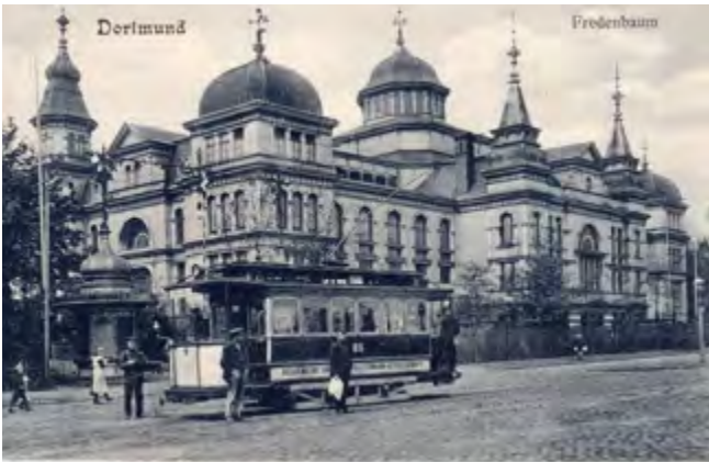
Berühmter Gigant: Zum größten Saalbau Deutschlands fährt natürlich auch die Straßenbahn.

beschlossen daher die Dortmunder Stadtverordneten, eine Promenade durch den Park anzulegen. Auch dachte man bereits über Parkbänke nach. Im Forstkulturplan von 1863 wurde „Am Fredenbaum“ das erste Mal offiziell als ein städtischer Park genannt. 1866 genehmigte man zwei zusätzliche Spazierwege. Auch die Ausflugslokale ließen nicht lange auf sich warten: Im historischen Katasterplan von 1872 sieht man bereits die Ausflugslokale „Hobertsburg“ und „Zum Fredenbaum“ am östlichen und südlichen Waldrand. 1883 entstand ein Gartensaal mit Biergarten, in dem Messen, Gewerbeausstellungen und Kaiserfeste stattfanden. Der Fredenbaumpark, zu dieser Zeit der einzige öffentliche Park Dortmunds, gewann als Naherholungsgebiet immer mehr an Bedeutung. Ab 1. Juni 1881 verkehrte sogar eine – damals noch mit Pferden gezogene – Straßenbahn zwischen dem Steinplatz in der Nordstadt und der Immermannstraße neben dem Fredenbaumpark. Als die Gaststätten „Zum Fredenbaum“ in den Besitz der Betreiber der Dortmunder Klosterbrauerei überging, ließen diese 1889 einen weiteren Saal fertigstellen, der mit 1.185 Plätzen für damalige Verhältnisse gigantisch und daher im gesamten Reich berühmt war. Am 21. August 1899 speiste dort Kaiser Wilhelm II. anlässlich seines Besuchs zur Hafeneinweihung.