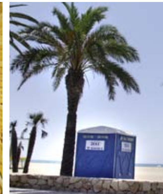
© TOI TOI & DIM Sanitairsysteme

Und auch in der Musik verbinden sich harte Sounds mit derber Sprache: »Piss off« – brüllten die Punkbands in die Mikros.