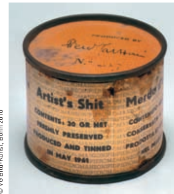
LINKS: PIERO MANZONI, MERDA D'ARTISTA (KÜNSTLERSCHIESS), 1961, FÄKALIEN IN METALLDOSE, AUFLAGE: 90 STÜCK.